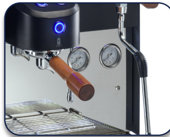
Anzeige des Dampf- und Pumpendrucks über Manometer