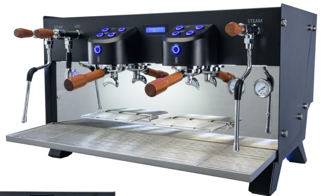
Carimali Glow, 2-gruppig, Farbe: schwarz