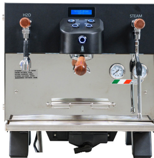
Carimali Glow, 1-gruppig Farbe: schwarz