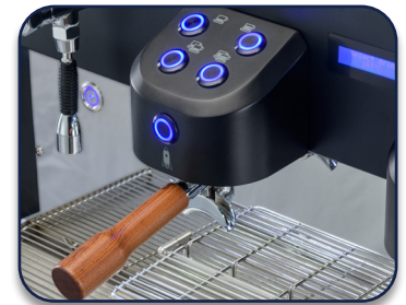
4 Produktwahltasten an jeder Brühgruppe