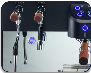
Dampfschwert und separater Heißwasserauslauf